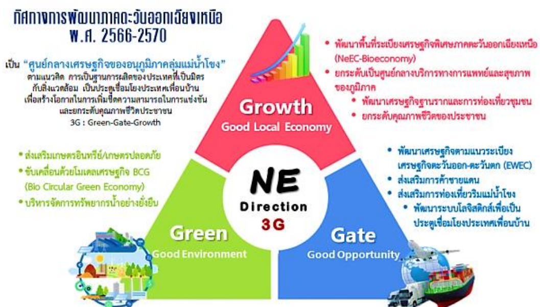
ภาพที่ 1 ทิศทางการพัฒนาภาคตะวันออกเฉียงเหนือ พ.ศ. 2566 - 2570

เป้าหมายการพัฒนาภาคตะวันออกเฉียงเหนือให้เป็น “ศูนย์กลางเศรษฐกิจของอนุภูมิภาคลุ่มแม่น้ำโขง”