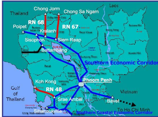
ภาพที่ 5 จุดผ่านแดนถาวรช่องสะงำ