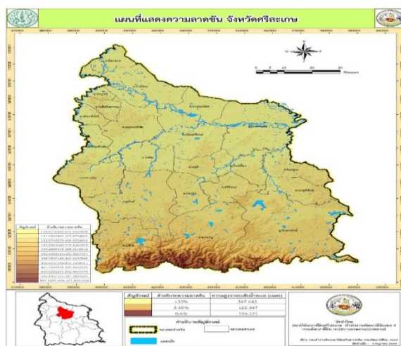
ภาพที่ 3 แผนที่แสดงความลาดชัน จังหวัดศรีสะเกษ