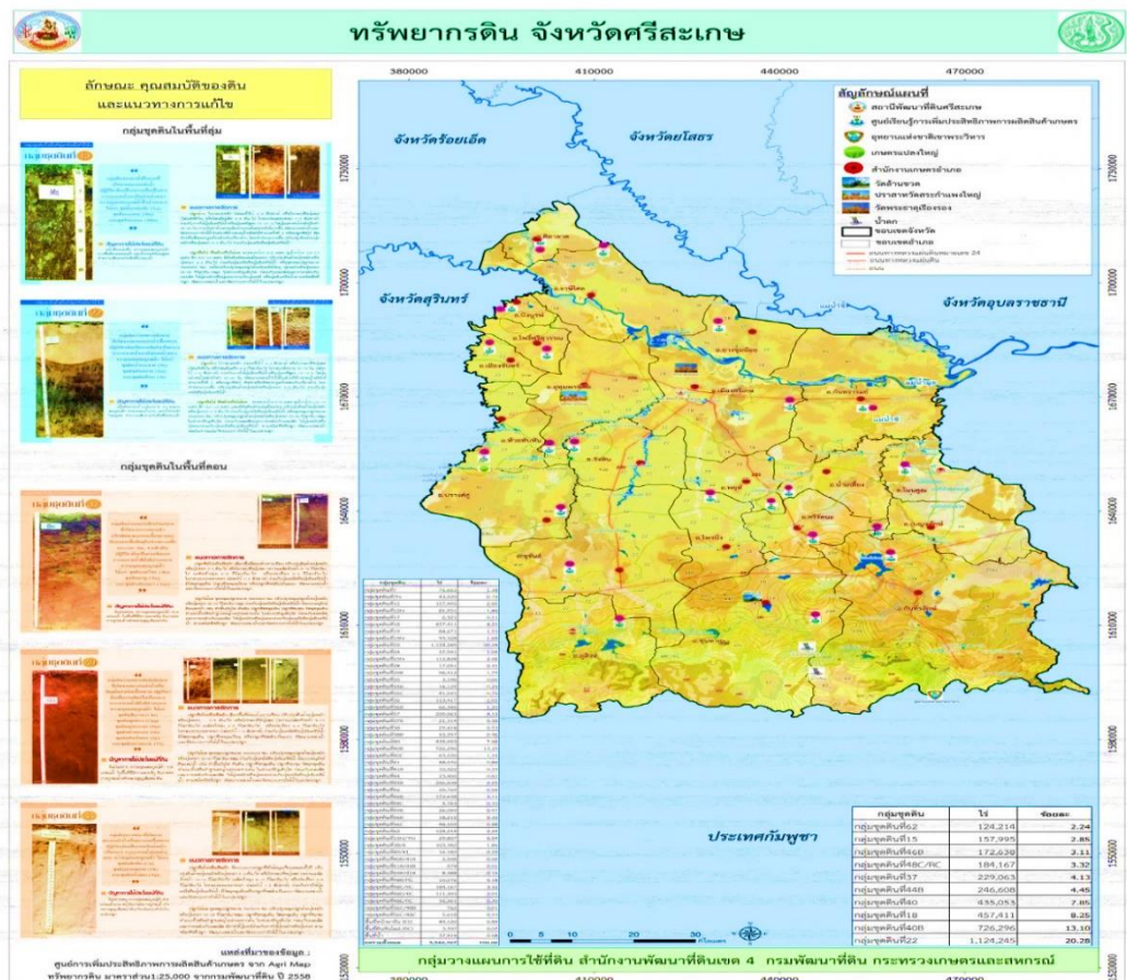
ภาพที่ 4 ทรัพยากรดิน จังหวัดศรีสะเกษ